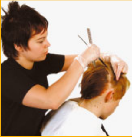
Psoriasis ei estä ottamasta hiuksiin käsittely- ja kampaajalla.

la, jotta lääkevalmiste, esim. kortisonivoide tai -liuos, pääsee vaikuttamaan läiskisiin. Hiuspohjan pehmittämiseen ja hilseen kuorimiseen käytetään salisyylivalmistetta, joka hierotaan jakausittain hiuspohjan hilseileville alueille. Aineen annetaan vaikuttaa useita tunteja tai pidempään, vaikkapa yön yli. Tämä hoito voidaan toistaa tarpeen mukaan esim. kahtena peräkkäisenä päivänä. Hiuspohjan pehmittämiseen voi käyttää pelkkää perusvoidetta, joko vesipi-toista lotionia tai rasvaisempaa voidetta, mutta myös ruokaöljyä.